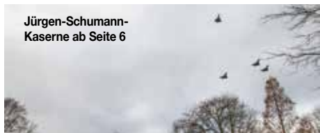
Jürgen-Schumann-Kaserne ab Seite 6

Das Titelbild wurde uns von der Luftwaffe zur Verfügung gestellt.